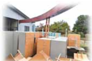
脱衣室ロッカーの撤去