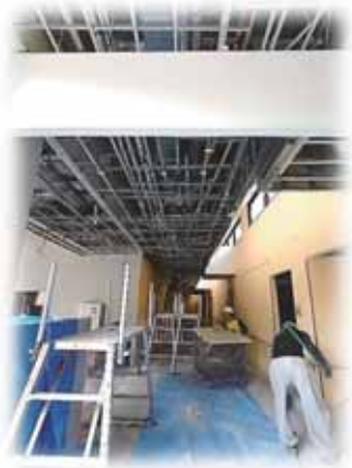
廊下天井材の撤去