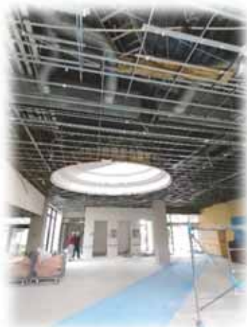
ホール天井材の撤去

工事期間中は、ご不便をおかけいたしますが、皆様のご期待に応えられるよう全力で取り組んでまいります。ご理解とご協力をよろしくお願い申し上げます。