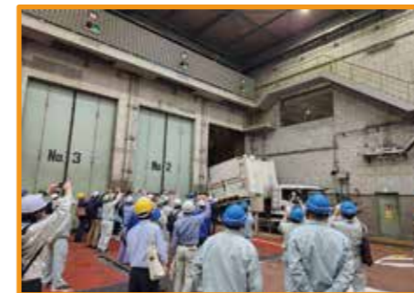
災害廃棄物の受入れのようす

西多摩衛生組合におきましても、構成市町(青梅市・福生市・羽村市・瑞穂町)の意思決定のもと、相互扶助の観点から、支援要請に応じていくことを決定し、羽村九町内会自治会生活環境保全協議会および瑞穂町環境問題連絡協議会(以下、「羽村・瑞穂両協議会」と締結している公害防止協定に基づく協議を進め、令和6年9月27日から災害廃棄物の受入れを開始しました。