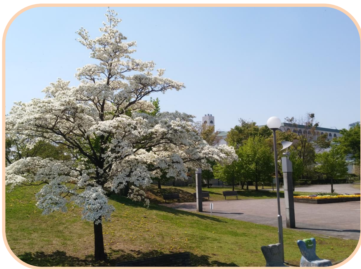
写真 フレッシュランド西多摩 構内散策路