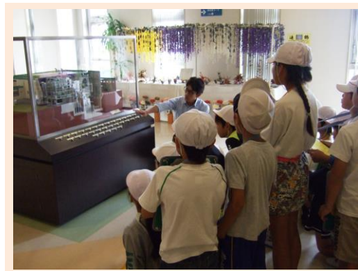
小学生の皆さんからのお手紙