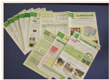
にしたまエコにゆうす

広報紙の発行は、周辺地域の自治体および町内会で組織する羽村九町内会自治会生活環境保全協議会ならびに瑞穂町環境問題連絡協議会区域（羽村市 9 町内会・瑞穂町 7 町内会）の全戸に配布（配布数約 22,000 部）するほか、構成市町の担当課窓口（P.8 参照）でも配布しています。平成 28 年度は、2 回の発行をしました。