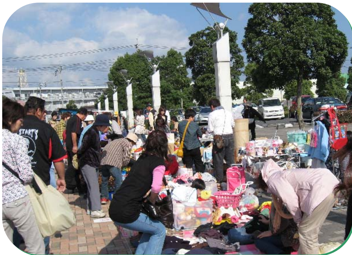
写真 余熱利用施設フレッシュランド西多摩 7周年記念イベントの風景